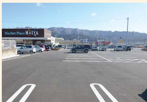
平成25年 2月 5日