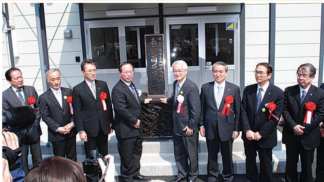
南三陸国道事務所開所式