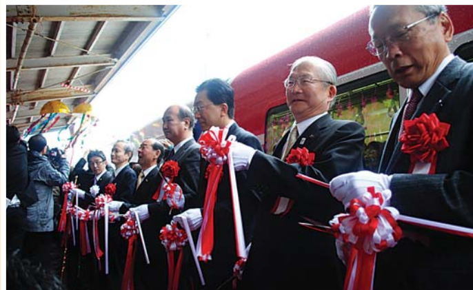
三陸鉄道・南リアス線盛—吉浜駅間運行再開