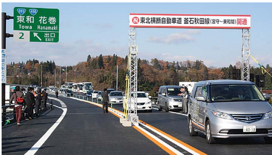
横断道宮守東和間開通 (H24.11.25)