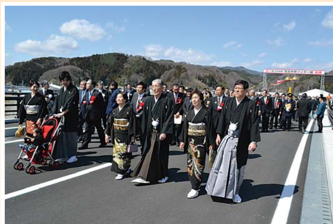
三陸沿岸道路「宮古中央インター線」渡り初め