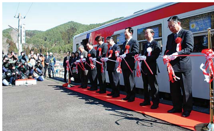
三陸鉄道・田野畑—陸中野田運行再開