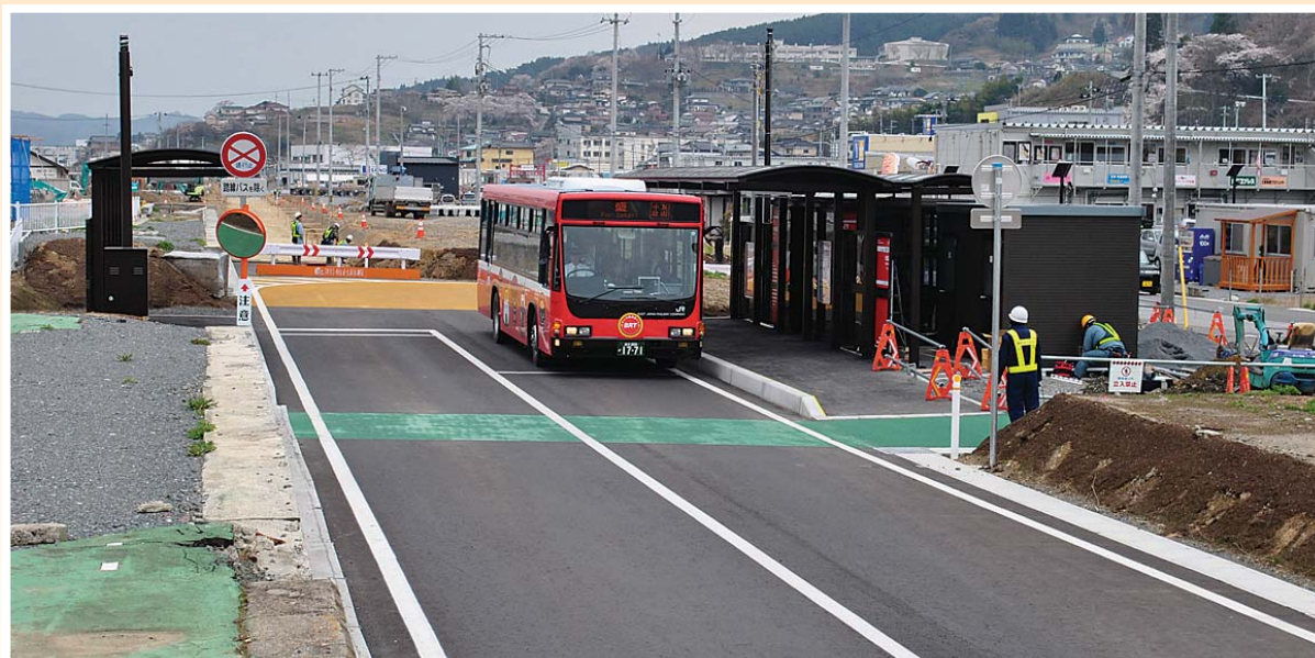
大船渡線 BRT大船渡駅（盛駅行きが出るところ）（H25）