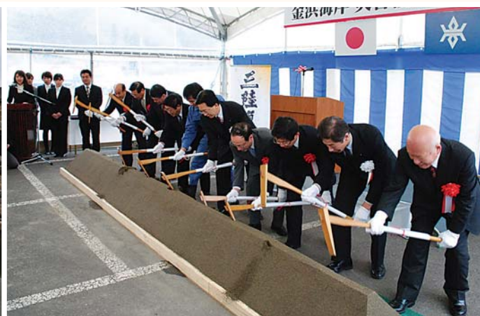
金浜海岸災害復旧工事