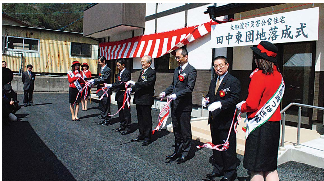
大船渡市 田中東団地の落成式