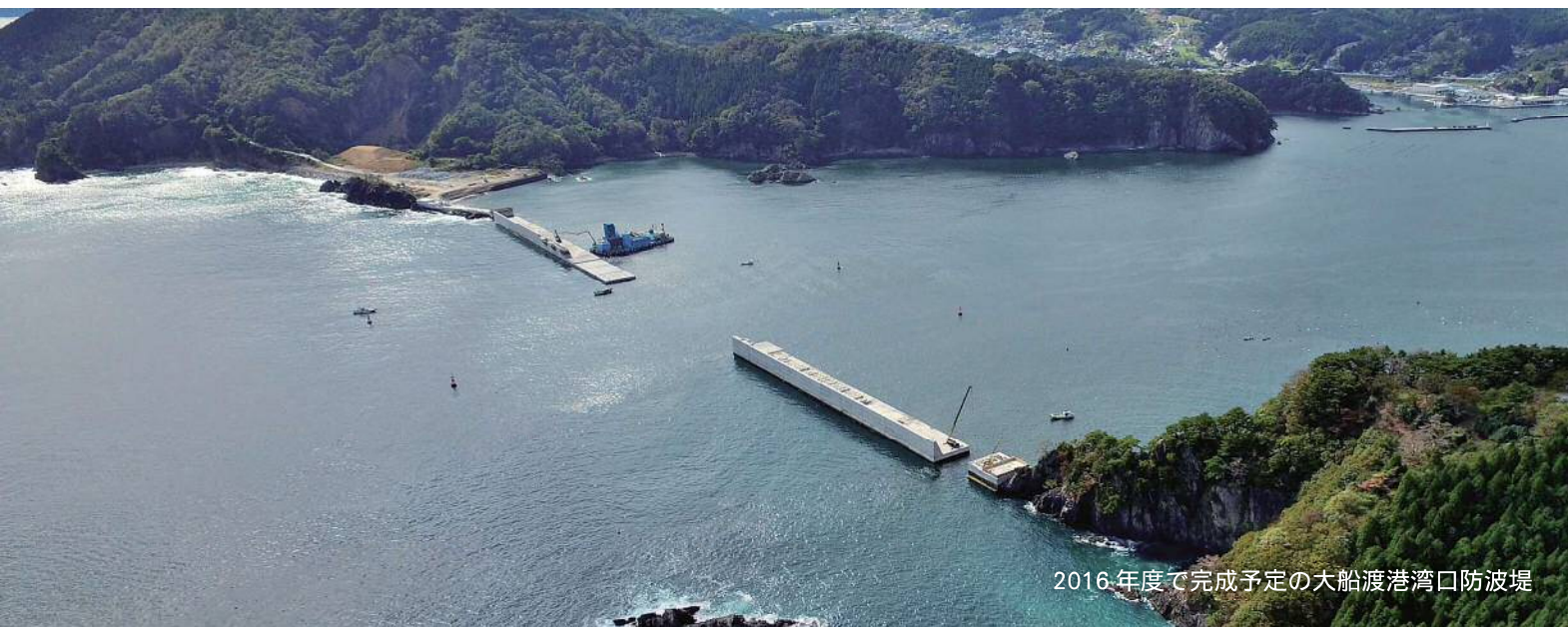
2016年度で完成予定の大船渡港湾口防波堤