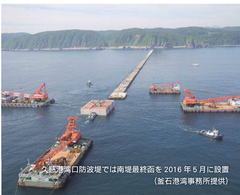
久慈港湾口防波堤では南堤最終函を2016年5月に設置