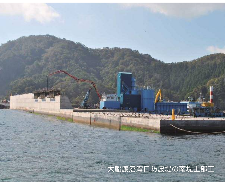
大船渡港湾口防波堤の南堤上部工