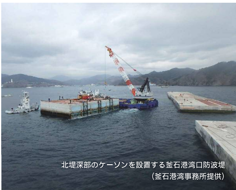
北堤深部のケーソンを設置する釜石港湾口防波堤