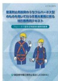
フルハーネス型安全帯使用作業 特別教育用テキスト

建防災岩手県支部では下記のとおり開催いたしますので、多数参加されますようご案内申し上げます。