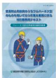
フルハーネス型安全帯使用作業特別教育用テキスト

建災防岩手県支部では下記のとおり開催いたしますので、多数参加されますようご案内申し上げます。